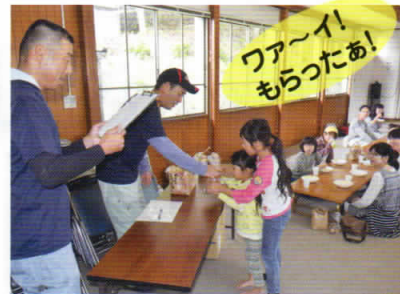
薪の割り方や飯ごうの炊き方などいろいろと教わりながら、大変上手に美味しく炊けました!