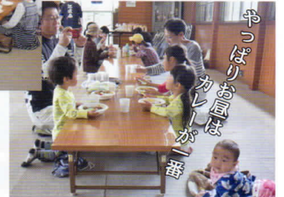
やっぱりお昼はカレーが一番