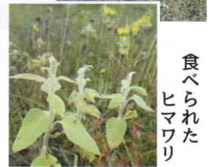
食べられたヒマワリ